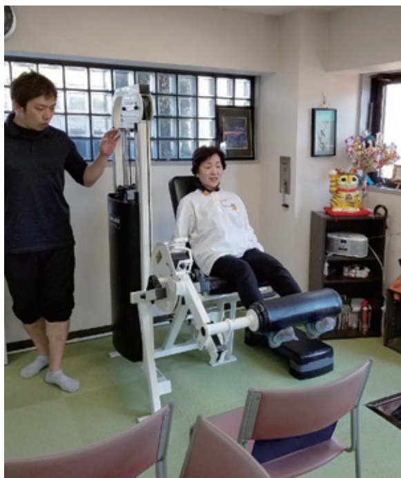
個別プログラムで自重・マシンを使い効果的に筋力アップ

膝痛や腰痛などの関節疾患にはさ まざまな原因があるが、「日常生活 の中には、膝や腰を痛めるきっかけ となるものが数多くある」と小田氏 は指摘する。「立ち座り、前かがみ、 段差の上り下り、歩き方など、長年、 無意識に行ってきた自身の身体を使 い方のクセを知ることから始める」と 話す。関節に負担をかけずに、筋 肉に頼るように日常生活動作を改 善していくことで、関節痛と筋力低 下の予防効果を得ることができ